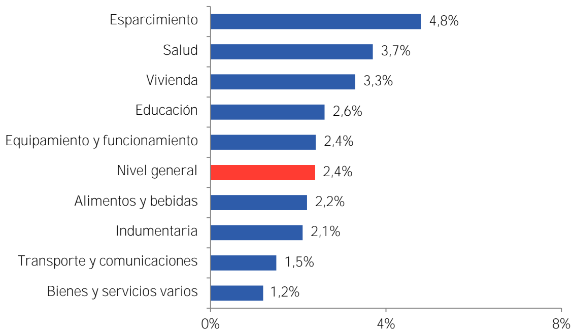
Gráfico 1: IPC CREEBBA por Capítulos Variación mensual – septiembre 2024 a octubre 2024

Por último, Equipamiento y funcionamiento evidenció un crecimiento del 2,4%. Los mayores incrementos se observaron en utensilios de limpieza (8,0%), artículos descartables (6,1%) y detergentes y desinfectantes (4,1%). En segundo orden se ubicaron artefactos a gas (3,3%), batería de cocina y cubiertos (2,7%) y electrodomésticos (2,4%), entre otros.