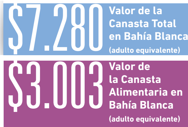
Cuadro 1: Canasta Alimentaria y Canasta Total para la localidad de Bahía Blanca (CREEBBA)

acumulado anual supera el 35%. Esto demuestra la importante incidencia del 9no mes del año en la Canasta Total.