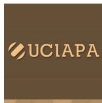
Unión del Comercio la Industria y el Agro de Punta Alta