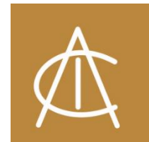
Asociación de Comercio e Industria de Cnel. Pringles