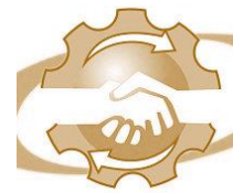
Cámara de Comercio e Industria y Anexos de Pigüé