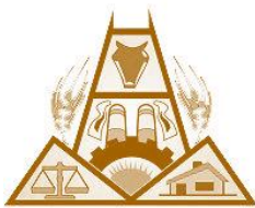
Cámara de Comercio, Industria, Productores y Propietarios de Puan