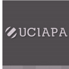
Unión del Comercio la Industria y el Agro de Punta Alta