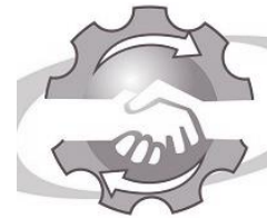
Cámara de Comercio e Industria y Anexos de Pigüé