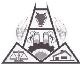
Cámara de Comercio, Industria, Productores y Propietarios de Puan